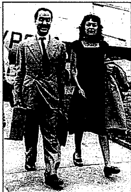
Lina Bo Bardi con il marito Pietro Maria Bardi

una mostra (Galleria internazionale d'arte moderna di Cà Pesaro, dal 10 settembre al 15 novembre, www.iuav.it , tel. 041-2571993), se ne può approfittare per andare oltre quel dato banalmente anagrafico. La Bo Bardi (il secondo cognome era quello del marito Pietro Maria, gallerista, critico d'arte, giornalista), i cui lavori più interessanti sono in Brasile, rappresenta una curiosa integrazione tra razionalismo europeo e «naturalità» popolare brasiliana